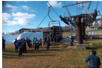
【冬季シーズン前救助訓練】